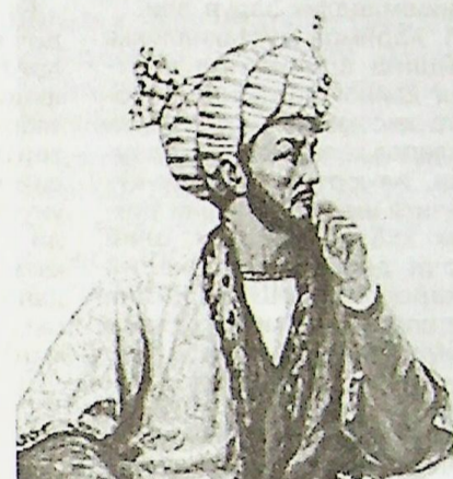
Бобур Мирзо таваллудига 534 йил тўлди