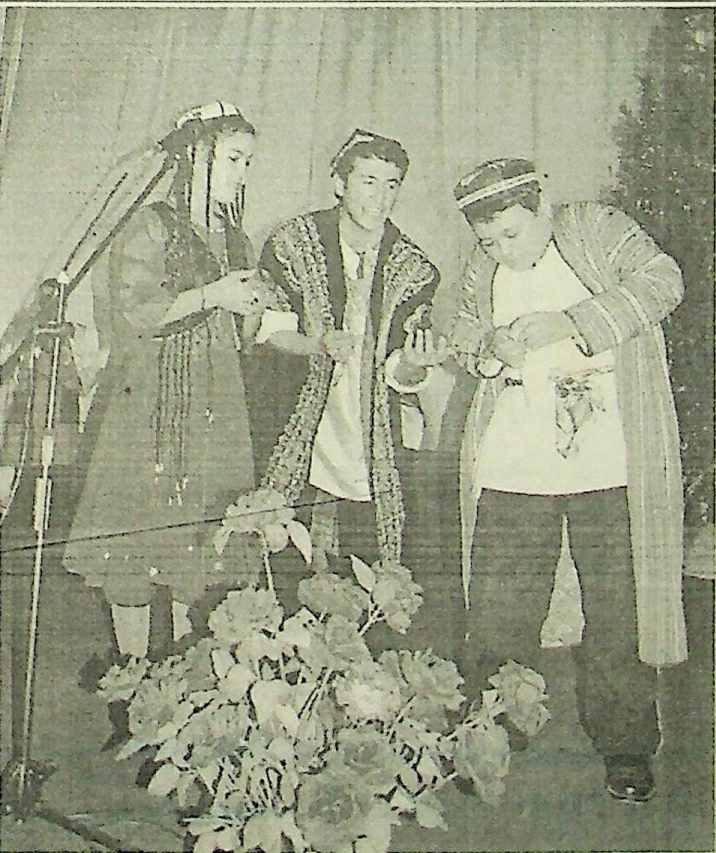
Институт талабалари жамоада ўтказиладиган турли тадбирларда фаол иштирок этиб, қизиқарли сахна кўринишларини намойиш этадилар.

Суратда: мусиқий таълим йўналиши талабалари сахнада.