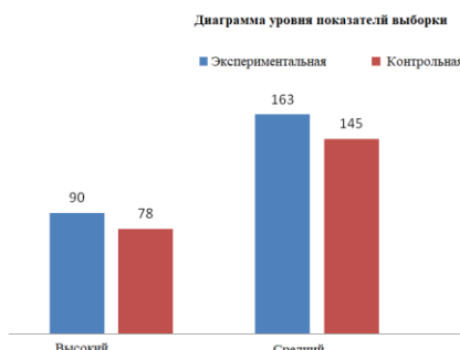
Схема 1. Навыковые показатели усвоения респондентов-студентов при формировании лингвистической компетентности путём виртуальных технологий (формирующий опыт).

На следующем этапе будет сформирована диаграмма, соответствующая этим выборкам: