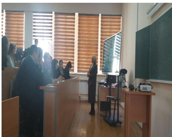
18.10.2021 йил. Очиқ дарс